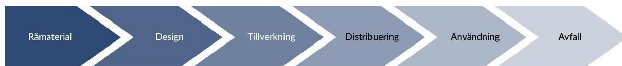
Figur 1. Illustration över den idag dominerande linjära konsumtionsmodellen, där resurser går från råmaterial till att slutligen bli avfall utan att materialet återvinns.

Genom att övergå till en cirkulär ekonomi finns en stor potential att minska resursanvändningen och därigenom begränsa klimat- och miljöpåverkan. En sådan omställning skulle bidra till att vi kan uppnå våra miljö- och klimatmål och de globala målen i Agenda 2030. EU har därför utarbetat en handlingsplan för den cirkulära ekonomin och Sveriges regering har antagit en nationell strategi för cirkulär ekonomi. Visionen i den nationella strategin lyder: "Ett samhälle där resurser används effektivt i giftfria cirkulära flöden och ersätter jungfruliga material."