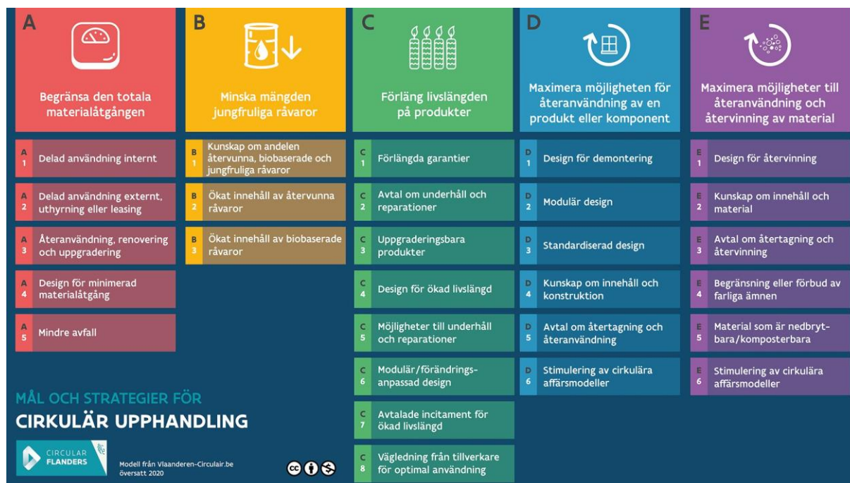
Figur 3. Modellen Mål och strategier för cirkulär upphandling.

För att säkerställa önskad effekt av genomförda upphandlingar är det avgörande att Region Örebro läns inköpsrutiner är utformade för att främja en cirkulär ekonomi samt bidrar till att upprätthålla hög leverantörstrohet och avtalstrohet.